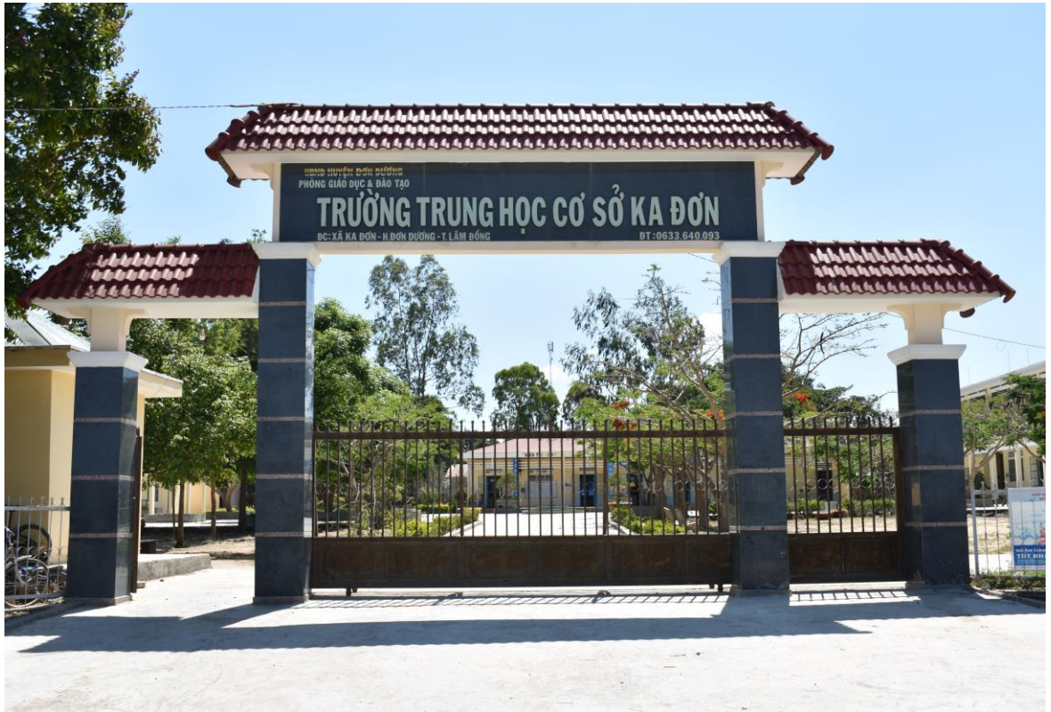
Trường Trung học cơ sở Ka Đơn

Về y tế xã được đầu tư nâng cấp về cơ sở vật chất, trang thiết bị khám chữa bệnh. Đội ngũ y bác sĩ đảm bảo việc chăm sóc sức khỏe ban đầu cho nhân dân, thực hiện tốt chế độ khám chữa bệnh, cấp thuốc miễn phí cho nhân dân, hạn chế thấp nhất bệnh nhân chuyển tuyến trên. Công tác tiêm phòng vacxin cho trẻ dưới 36 tháng tuổi hàng năm đạt 97,6%. Tỷ lệ suy dinh dưỡng trẻ em từ 29,61% (năm 2000) còn 21,48% (năm 2004). Tỷ lệ sinh con thứ ba giảm đáng kể từ 23,8% (năm 2000) còn 12,9% (năm 2004).