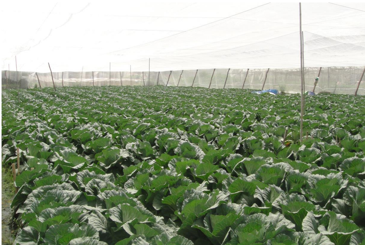
Rau công nghệ cao

Trong chăn nuôi đã có chuyển biến từ chăn thả sang chăn dắt, nhân dân đã tận dụng diện tích đất bờ vùng, bờ thửa, giành một phần diện tích đất nông nghiệp để trồng cỏ chăn nuôi. Tổng đàn gia súc bình quân hàng năm tăng 10 - 12%. Thực hiện lai Sind 50% đàn bò cỏ địa phương. Đàn heo được duy trì, đây là nguồn thu nhập của một số hộ gia đình; thực hiện mô hình nuôi và phát triển đàn heo đen trong vùng đồng bào dân tộc thiểu số có kết quả tốt. Hàng năm đảm bảo 90 - 95% vật nuôi trong tổng đàn nên không có tình trạng dịch bệnh xảy ra trên địa bàn.