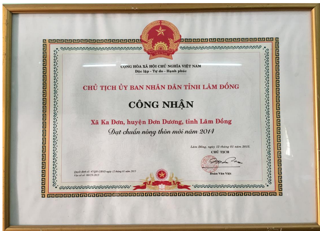
Xã đạt chuẩn Nông thôn mới năm 2014

Bên cạnh những kết quả đạt được vẫn còn tồn tại một số hạn chế, khuyết điểm sau: