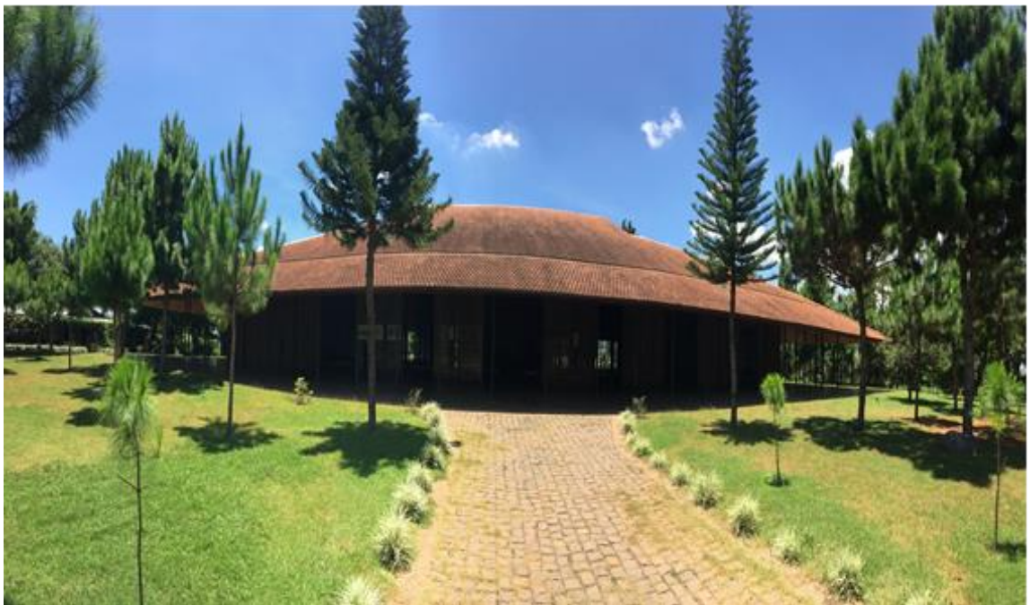
Nhà thờ Ka Don

Về tôn giáo, có 03 tôn giáo chính: Phật giáo, Công giáo, Tin Lành, cơ sở thờ tự gồm 01 chùa, 01 nhà thờ Công giáo, 04 điểm sinh hoạt đạo Tin Lành.