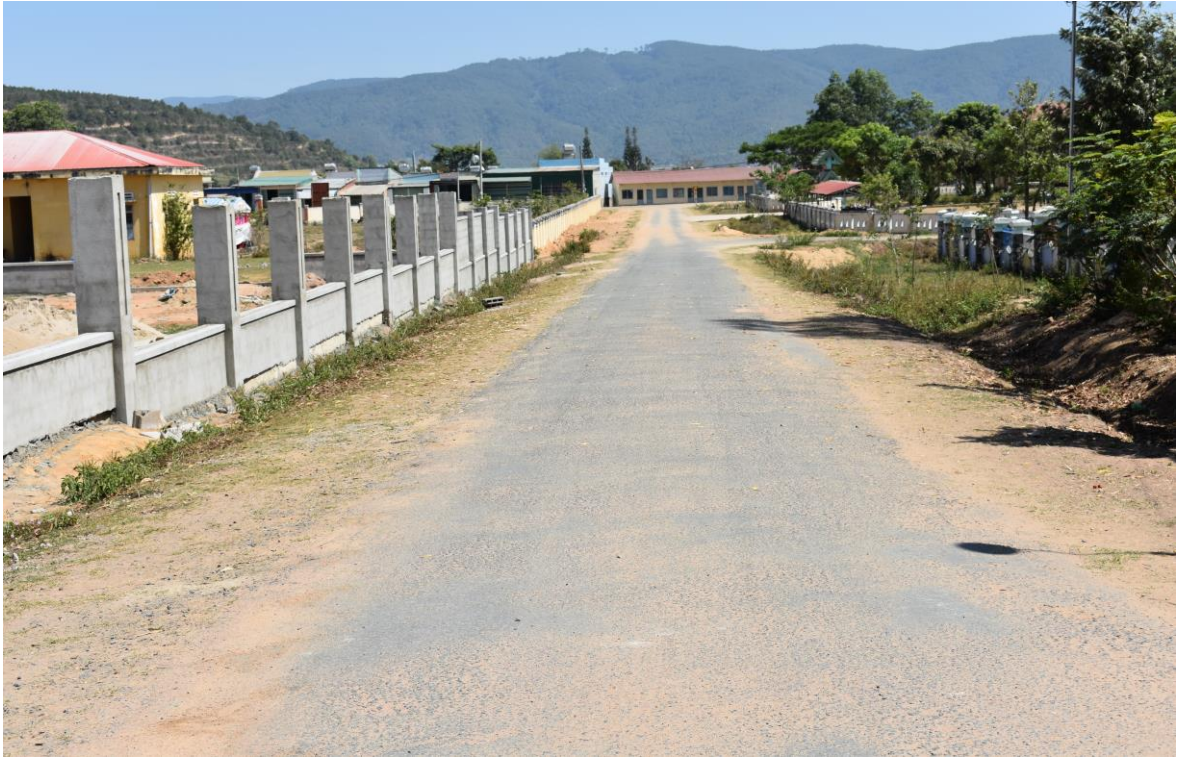
Đường nhựa khu trung tâm

tâm hỗ trợ xây dựng cơ sở hạ tầng kinh tế - xã hội tạo điều kiện cho địa phương phát triển.