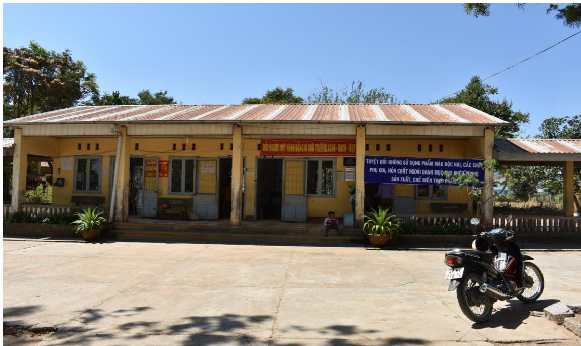
Phòng khám đa khoa xã Ka Đơn

Công tác quản lý các hoạt động văn hóa đi vào nền nếp, các tập tục lạc hậu trong vùng đồng bào dân tộc thiểu số có giảm. Thực hiện tốt cuộc vận động toàn dân đoàn kết xây dựng đời sống văn hóa. Đối với các gia đình thuộc diện chính sách, ngoài chế độ ưu đãi của Nhà nước, xã thường xuyên chăm lo, giúp đỡ, tạo điều kiện vật chất để các gia đình chính sách vươn lên có mức sống trung bình, khá của xã.