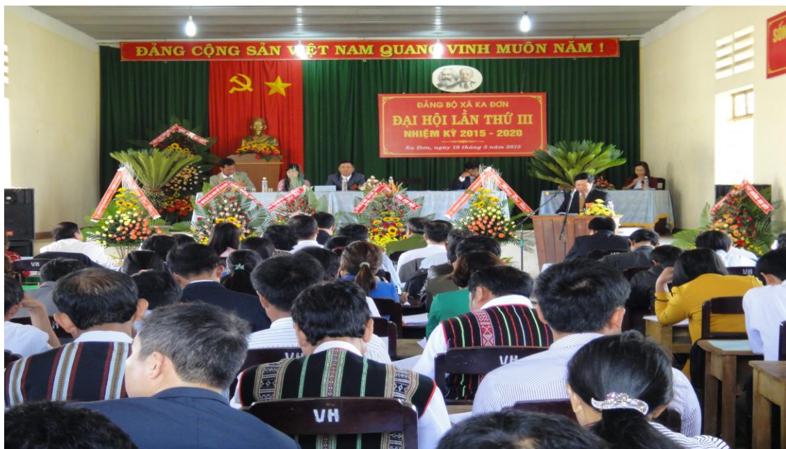
Đại hội Đảng bộ xã Ka Đơn lần thứ III nhiệm kỳ 2015 - 2020

Thực hiện Chỉ thị số 36-CT/TW, ngày 30/5/2014 của Bộ Chính trị, Chỉ thị số 28-CT/TU, ngày 8/7/2014 của Tỉnh ủy Lâm Đồng và Kế hoạch số 136-KH/HU, ngày 24/9/2014 của Ban Thường vụ Huyện ủy về Đại hội đại biểu các cấp tiến tới Đại hội đại biểu toàn quốc lần thứ XII của Đảng. Trong hai ngày 18 và 19 tháng 5 năm 2015, Đảng bộ xã Ka Đơn tiến hành Đại hội lần thứ III, nhiệm kỳ 2015 - 2020. Dự Đại hội có 105/108 đảng viên được triệu tập. Đại hội thảo luận và góp ý các dự thảo văn kiện trình Đại hội đại biểu toàn quốc lần thứ XII của Đảng, dự thảo văn kiện trình Đại hội đại biểu Đảng bộ huyện lần thứ XI. Đại hội với tinh thần trách nhiệm cao, tập trung trí tuệ, phát huy dân chủ để thảo luận và tham gia góp ý vào dự thảo báo cáo chính trị, báo cáo kiểm điểm Ban Chấp hành Đảng bộ xã lần thứ II nhiệm kỳ 2010 - 2015.