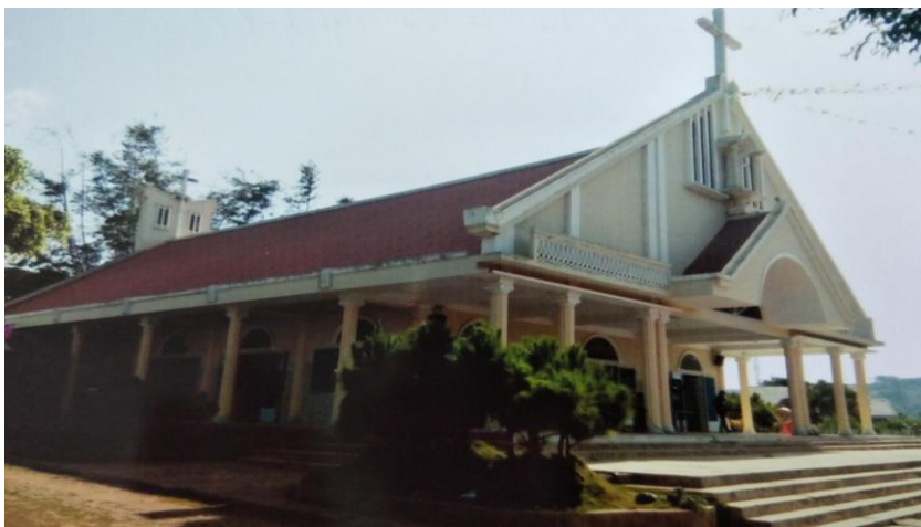
Nhà thờ dòng Vinh Sơn (xây dựng năm 1995)