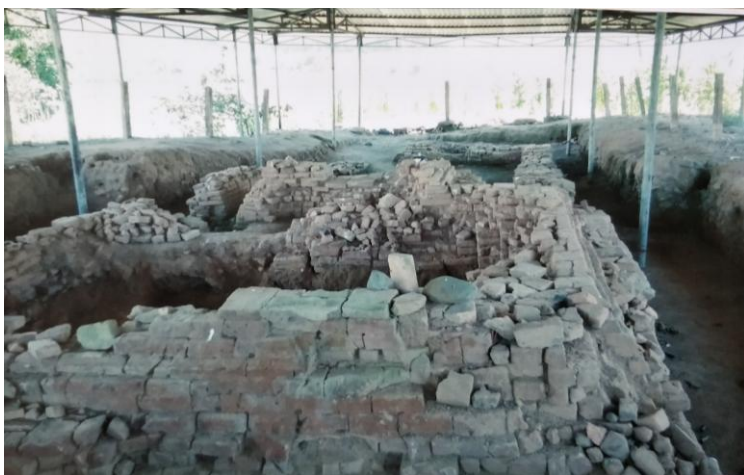
Khu di chỉ khảo cổ học văn hóa Chăm (thôn Pró Ngó)

Pró có khu di chỉ khảo cổ văn hóa Chăm, có cảnh quan đẹp như núi đồi, ruộng, vườn hoa màu, có ít hồ đập diện tích nhỏ.