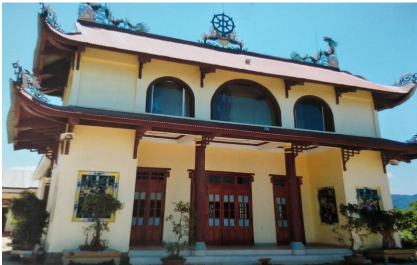
Chùa Giác Hưng

Về tôn giáo, có 03 tôn giáo chính: Phật giáo, Công giáo và Tin Lành. Cơ sở thờ tự gồm 01 chùa, 01 nhà thờ Công giáo.