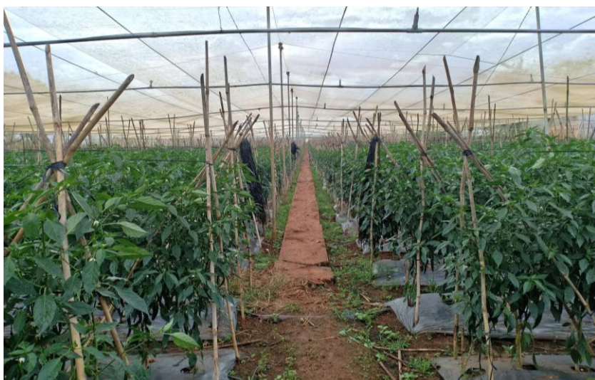
Sản xuất rau thương phẩm công nghệ cao

được tăng dần qua hàng năm 72 . Mạng lưới cộng tác viên khuyến nông phủ khắp 7/7 thôn phục vụ cho công tác chuyển giao khoa học kỹ thuật, triển khai các chương trình đầu tư vào sản xuất nông nghiệp làm cho năng suất, chất lượng nông sản tăng, nâng cao thu nhập và ổn định đời sống nhân dân góp phần vào chuyển đổi cơ cấu cây trồng phù hợp ở địa phương.