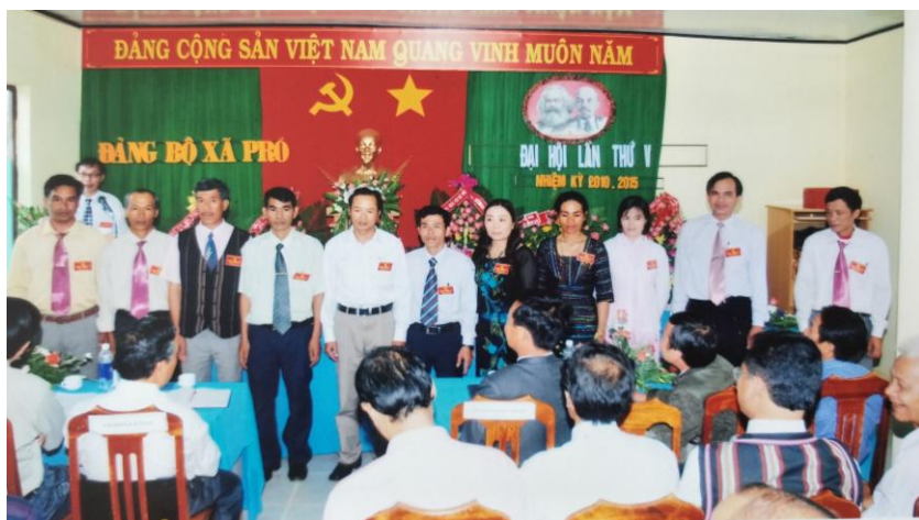
Đại hội Đảng bộ xã lần thứ V nhiệm kỳ 2010 - 2015

Sau 5 năm thực hiện nghị quyết Đại hội, Đảng bộ đã đạt được những kết quả sau: