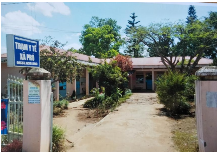
Trạm y tế xã Pro

được tiêm chủng, 7/7 thôn đều có y tế thôn bản. Duy trì 10 chuẩn quốc gia về y tế tuyến xã; chất lượng khám chữa bệnh có chuyển biến tiến bộ; thực hiện đúng chính sách của Đảng và Nhà nước đề ra về việc khám chữa bệnh miễn phí cho người dân và trẻ em dưới 6 tuổi. Tiếp tục xã hội hóa công tác dân số - kế hoạch hóa gia đình, tỷ lệ tăng dân số tự nhiên giảm 66 .