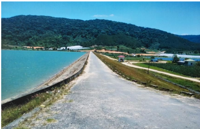
Đập thủy lợi Pró