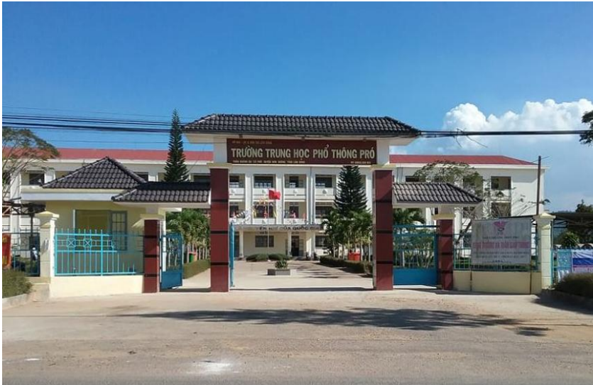
Trường Trung học phổ thông Pró

sĩ số đạt cao 46 . Chất lượng dạy học hàng năm đạt khá 47 . Xã hoàn thành phổ cập giáo dục tiểu học.