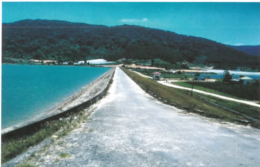
Đập thủy lợi Pró