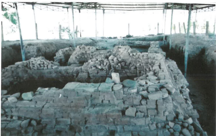
Khu di chỉ khảo cổ học văn hóa Chăm (thôn Pró Ngó)

Pró có khu di chỉ khảo cổ văn hóa Chăm, có cảnh quan đẹp như núi đồi, ruộng, vườn hoa màu, có ít hồ đập diện tích nhỏ.