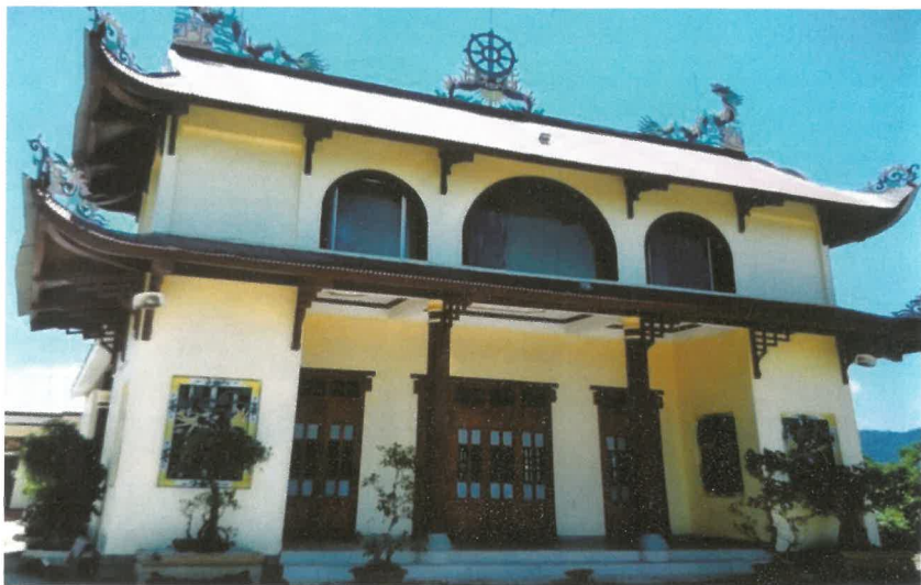
Chùa Giác Hưng

Về tôn giáo, có 03 tôn giáo chính: Phật giáo, Công giáo và Tin Lành. Cơ sở thờ tự gồm 01 chùa, 01 nhà thờ Công giáo.