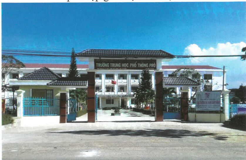
Trường Trung học phổ thông Pró

sĩ số đạt cao 46 . Chất lượng dạy học hàng năm đạt khá 47 . Xã hoàn thành phổ cập giáo dục tiểu học.