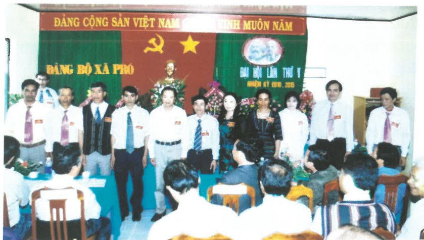
Đại hội Đảng bộ xã lần thứ V nhiệm kỳ 2010 - 2015

Sau 5 năm thực hiện nghị quyết Đại hội, Đảng bộ đã đạt được những kết quả sau: