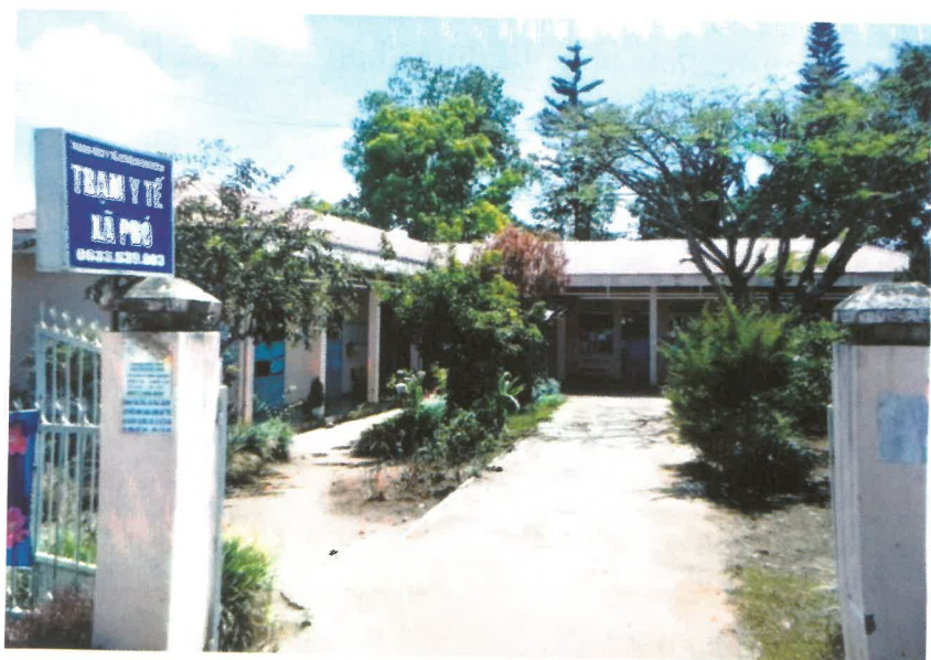
Trạm y tế xã Pró

được tiêm chủng, 7/7 thôn đều có y tế thôn bản. Duy trì 10 chuẩn quốc gia về y tế tuyến xã; chất lượng khám chữa bệnh có chuyên biến tiến bộ; thực hiện đúng chính sách của Đảng và Nhà nước đề ra về việc khám chữa bệnh miễn phí cho người dân và trẻ em dưới 6 tuổi. Tiếp tục xã hội hóa công tác dân số - kế hoạch hóa gia đình, tỷ lệ tăng dân số tự nhiên giảm 66 .