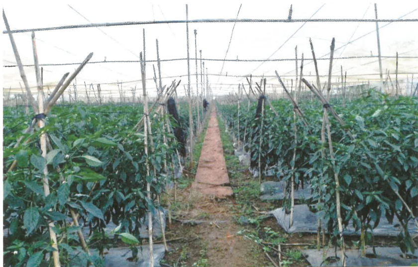
Sản xuất rau thương phẩm công nghệ cao

được tăng dần qua hàng năm 72 . Mạng lưới cộng tác viên khuyến nông phủ khắp 7/7 thôn phục vụ cho công tác chuyển giao khoa học kỹ thuật, triển khai các chương trình đầu tư vào sản xuất nông nghiệp làm cho năng suất, chất lượng nông sản tăng, nâng cao thu nhập và ổn định đời sống nhân dân góp phần vào chuyển đổi cơ cấu cây trồng phù hợp ở địa phương.