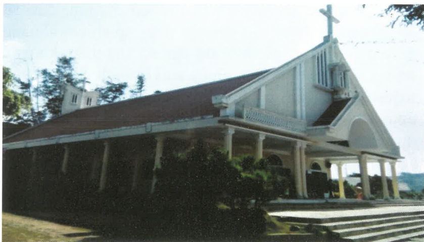
Nhà thờ dòng Vinh Sơn (xây dựng năm 1995)